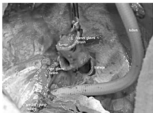
Slika 3. Operativna procedura